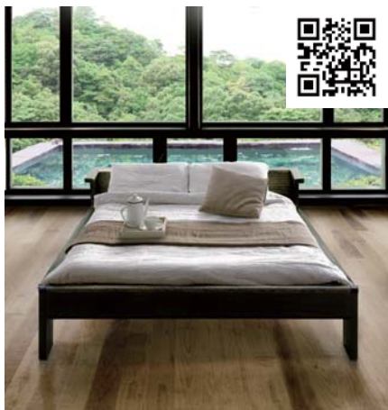
一番人気の総桐ベンチベッド

今、桐のベッドが話題になっている。桐の持つパワーを最大に活かしたベッドで熟睡ができるというのだ。質の良い眠りが健康にも良いということ、桐のベッドが注目