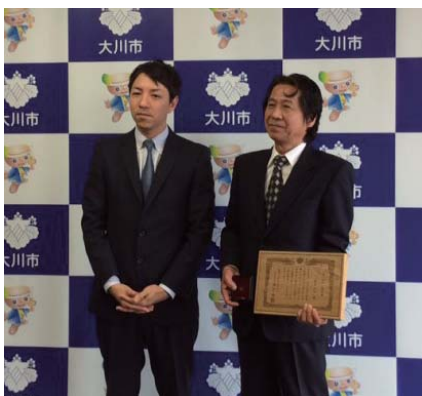
大川の匠 認定式の様子

福岡県にある大川市地域は、日本最大の家具の産地で有名。大川家具は四八〇年の歴史があり、桐箆笥は、福岡県の伝統工芸特産品に指定されている。その中で桐里工房(きりこうぼう)は、「福岡県の現代の名工」を受賞。6人目となる「大川の匠」に認定され、大川の家具職人の中で桐里工房を知らない人はいないほどだ。日本のみならず、海外のセレブにも桐里工房のファンは広がっている。いつかは桐里工房の桐箆笥や桐家具を欲しいと考えている人も多い。