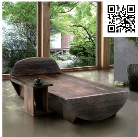
焼桐モダンベッド

材の椅子に、4時間程座りっぱなしだが、こんなに長時間座っても、お尻も腰も全く痛くなっていない。