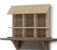
神棚とは思えない程のモダンデザイン