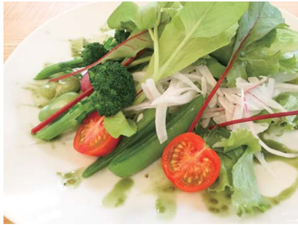
えすぷりっとイチオシ!朝採り元気サラダ

一晩干した野菜をオリーブオイルで素揚げにしてあります。手を掛けて作られた健康メニューは、一度食べたら、やみつきになりそう。