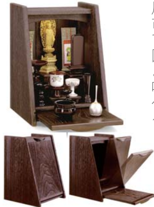
開くタイプのお仏壇