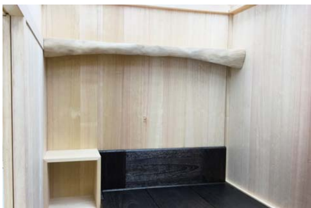
寝室タイプの一例

きるよう、設計されている。写真は寝室用カスタマイズで、シングルベッドの横にミニデスクがあり、ベッドが椅子代わり。ベッドの頭上部には、桐の本来の木肌を活かした棚があり、ここには、スピーカーを置いたり、好きな本を並べたり、好きなディスプレイを楽しめる。ダブルベッドが置けるサイズの部屋まで拡張可能だ。ミニデスク付きなので、勉強はもちろん、仕事をする書斎など、かなり集中して取り組みそう。